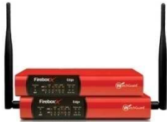
Firebox X Edge